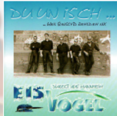
Du un isch 1999