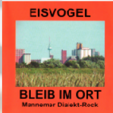
Bleib im Ort 1996