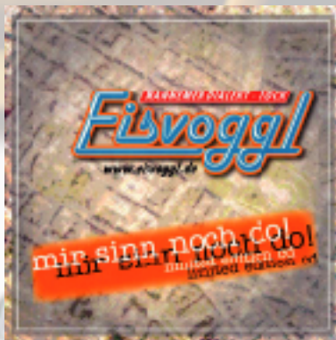
Mir sinn noch do 2005